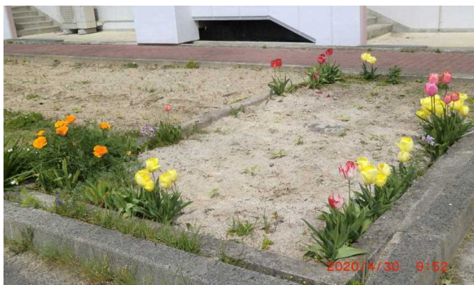
【きれいな花が咲いています】