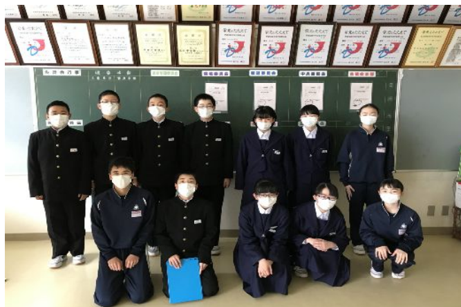
～学級役員メンバーです～

1年の時の経験を活かし、委員長や副委員長を支えられるようにしたいです。また、 積極的に行動して、クラスみんなが気持ちよく過ごせるようにリードしていける存在 になりたいです。