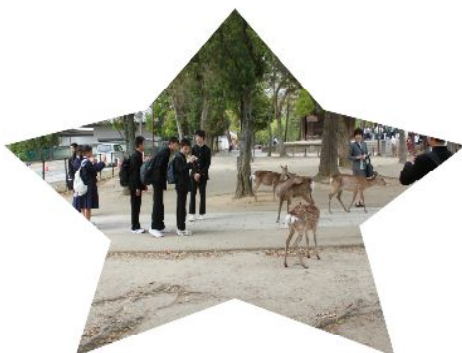
奈良公園の 鹿と共に