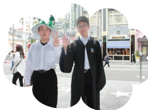
USJ マントと ハット