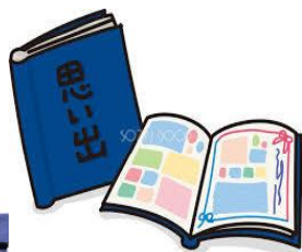
東大寺の 穴くぐり