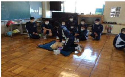
～心臓 マッサージの 実習～

☆実際に AED や心臓マッサージをしていて、「もう無理」とか「疲れた」などは言っていないと想像した。 人を助けることは命がけなんだ と改めて思った。今回の授業で、 応急処置をすることで命を救えるかもしれない ということは、 とても素晴らしく大切なことだ と思える時間だった。感謝。(女子)