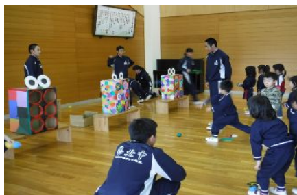
ストラックアウト？

☆園児たちと遊んだり、ゲームの説明をしたりするのがすごく難しかったです。でも、園児たちと楽しく遊べたし、交流もできたので良かったです。