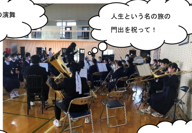
人生という名の旅の 門出を祝って!