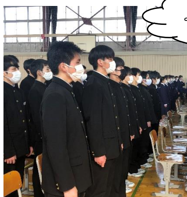
よっ!手拍子先導部隊!