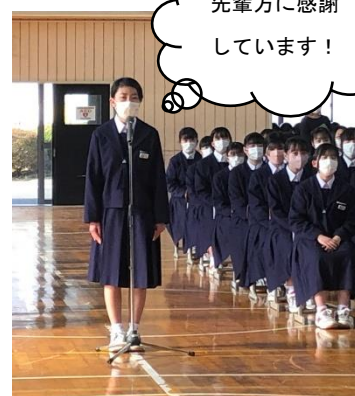
先輩方に感謝 しています!

3年生は私たちの模範であり、様々なことを学びました。今まで見守ってくれた先輩方には感謝の気持ちで一杯です。県北中の伝統を受け継ぎ、後輩の面倒もしっかり見る3年生になります。