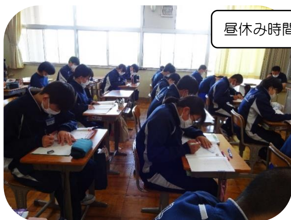
昼休み時間の学習の様子

今週25日(水)に1学期中間テストを実施しました。校内では、先週金曜日から朝自習時間と昼休み時間をテスト勉強の時間に充てて取り組んでいましたが、ご家庭での学習の様子はいかがだったのでしょうか？計画通りに進んでいた生徒、テスト2日前でも範囲内のワークが終わらず焦っていた生徒など、まだまだ学習に対する意識の差が大きいようです。6月は、期末テストと第1回の実力テストが控えています。進路に向けて今できることは、学習習慣をしっかりと身に付けることです。今回の学習の取り組み方や家庭での時間の使い方などを振り返り、今後の自分の学習について改めて考えてほしいと思います。(結果の個票は6月1日に配付予定です。)