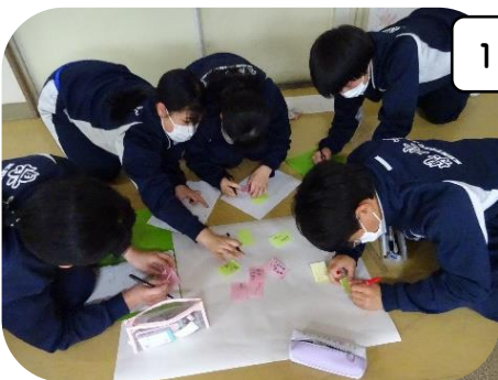
1回目のオリエンテーションの様子

今は、「歴史」「特産物」「風景」「行政」「観光」の5つのテーマに沿った班に分かれ、それぞれの視点から調べ学習を行っています。最終的には、「15秒動画を撮影し、国見を発信する」ことを目標としています。動画の絵コンテの描き方を学び、実際に描くことの難しさを味わいながら、完成に向けて楽しく進めています。これからの総合学習の様子は、随時お伝えしていきます。