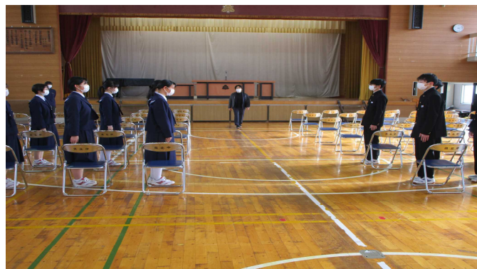
【 入退場の練習 】