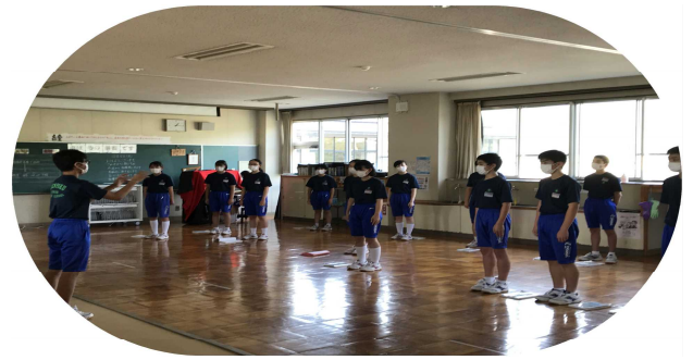
～3組の合唱練習の様子～

私は、「信じる」の伴奏練習を7月中旬から始めました。練習は大変で“なぜ私だけ”と涙する日も多くありました。ですが、たくさんの人に支えてもらい、今たくさん練習することができています。これから本番まで3組全員で努力し、目標を果たせることを信じています。合唱コンクールが終わったときには、支えてくれた方々全員に感謝します。