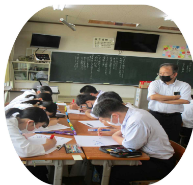
校長先生も 視察中 2組