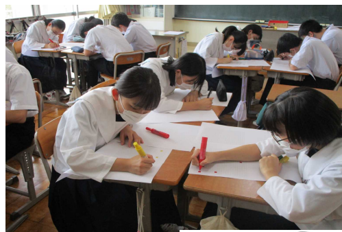
グループで 作成中 3組

令和3年度は、県北中学生徒全員でビックアートを作成しています。どんなアートに完成するのか・・・当日がとても楽しみです。