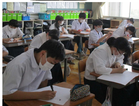
黙々と 作成中 1組