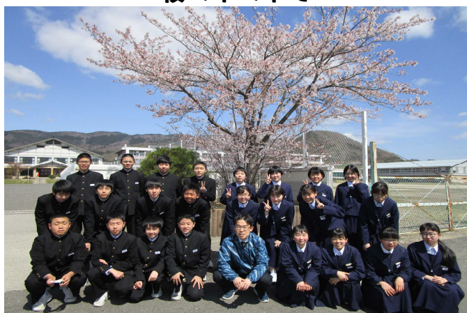
【 3年1組 】