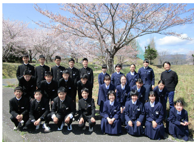
【 3年3組 】