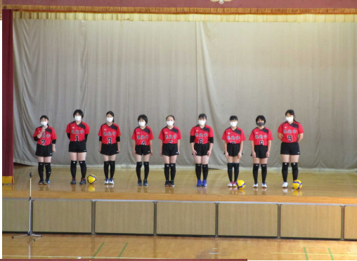
女子 バレー ボール部