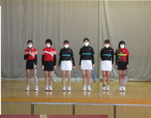
女子 ソフト テニス部