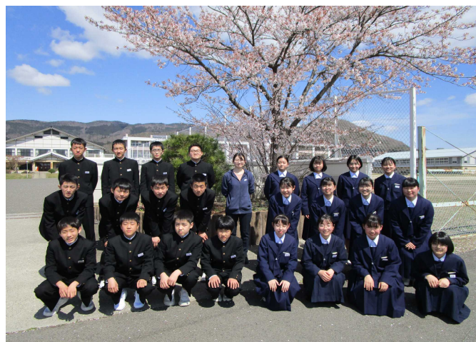
【 3年2組 】