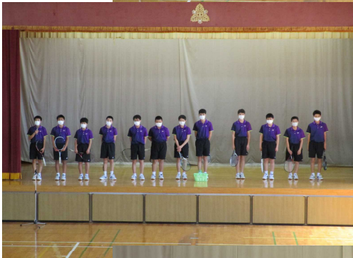
男子 ソフト テニス部