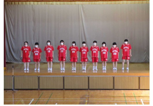
女子 バスケット ボール部