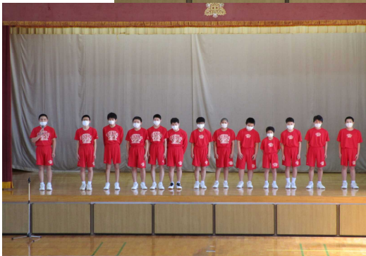
男子 バスケット ボール部