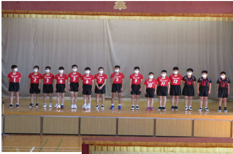
男子バレー ボール部