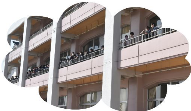
2階でエールを受ける3年生