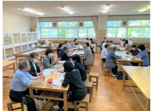
<くにも学園について話し合うCS委員>